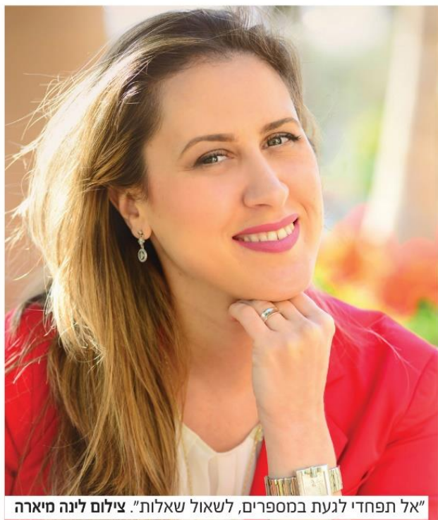
"אל תפחדי לגעת במספרים, לשאול שאלות".

הם הראשונים שתוכלי להתאמן עליהם עם השיווק והמכירות... ומה באשר לאמונה העצמית? "בלי אמונה עצמית פשוט לא ניתן לצאת לדרך! כל המשתנים מסביב יכולים להופיע או להעלם. היום יש לקוח, מחר כבר אין. היום יש מלה טובה ופרגון, אולי מחר כבר לא יהיה... מה שבטוח חייב להיות כל הזמן זה עמוד שדרה פנימי שלך, הקשבה פנימה ואמונה עצמית.